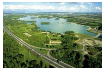
Parc de Miribel Jonage

Pour accueillir les nouveaux habitants, le SCOT préconise un modèle de développement urbain plus dense. Le renforcement de l'intensité urbaine, sans nuire à la qualité de vie des habitants, grâce à de nouvelles formes urbaines, participe à la préservation des espaces naturels.