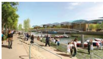
Futur parc de la Confluence

Au sein des bassins de vie, les polarités urbaines fournissent aux habitants toutes les fonctions de la vie quotidienne : habitat, activités, commerces et équipements. C'est le concept de la multifonctionnalité, celui d'une ville « mixte » et des courtes distances où cohabitent toutes les fonctions urbaines.