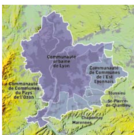
Périmètre du SCOT

Document de planification urbaine, le Schéma de cohérence territoriale (SCOT) dessine un modèle de développement du territoire pour les 20 ans à venir. Il vise à doter l'agglomération lyonnaise de nouvelles orientations d'aménagement et à coordonner les politiques publiques touchant à toutes les dimensions de la vie quotidienne : se loger, se déplacer, travailler, se distraire. Le SCOT conjugue développement économique et démographique, respect de l'environnement, équité sociale et solidarité territoriale.