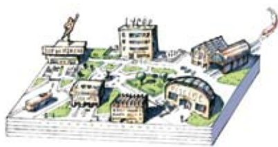
Bassin de vie

Loin d'être concentré au cœur de l'agglomération, le développement urbain s'organise autour d'une douzaine de bassins de vie et une vingtaine de polarités urbaines. Ce nouveau cadre de référence, destiné à limiter les déplacements, et notamment l'usage de la voiture, conjugue équipements commerciaux, éducatifs, sportifs et de santé.