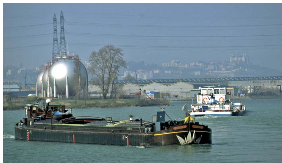
Péniche sur le Rhône, Lyon