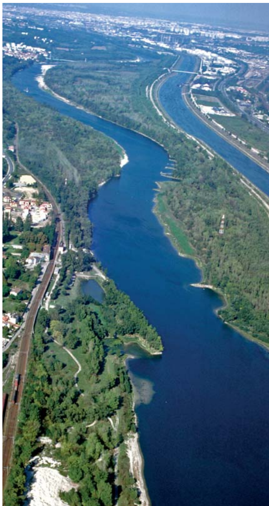
Grigny - île de la Table ronde