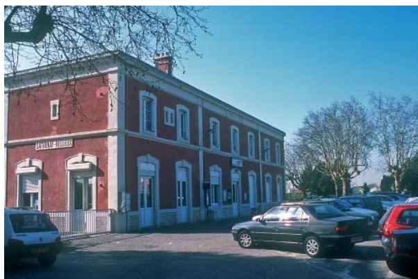
La gare de Sathonay-Rillieux

Il s'agit de localiser prioritairement le développement urbain résidentiel et les pôles d'emplois, notamment tertiaires, d'abord dans les secteurs situés à proximité immédiate des gares et stations du RER, ensuite dans des périmètres plus larges où le rabattement par d'autres modes apparaît pertinent.