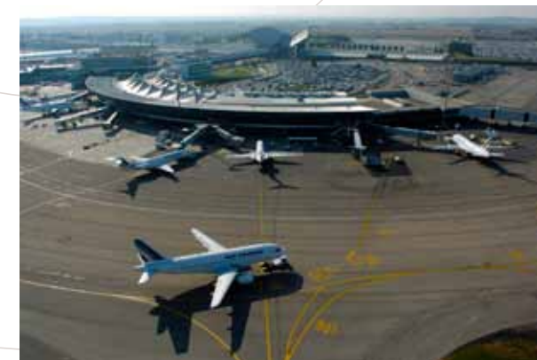
Site de l'aéroport de Saint-Exupéry

Pilotée par les services de l'État (DDT du Rhône), cette démarche associe un grand nombre de partenaires, collectivités, aéroport, chambres consulaires. Elle s'appuie sur les conclusions, livrées fin 2012, d'un groupement de bureaux d'études piloté par l'Agence d'Architecture « Güller Güller ». Associé par l'État ainsi que trois autres Scot concernés par le périmètre d'étude, le Sepal s'est beaucoup investi dans cette réflexion qui vise à produire une « stratégie guide » pour ces territoires. L'ensemble des acteurs rhodaniens et Nord-Isérois se sont accordés sur une série d'enjeux et d'orientations qui supposent un toilettage de la Directive territoriale d'Aménagement approuvée en 2007. Des consultations sont aujourd'hui lancées par l'État en ce sens tout en réaffirmant l'objectif d'élaborer un Schéma de référence en 2013.