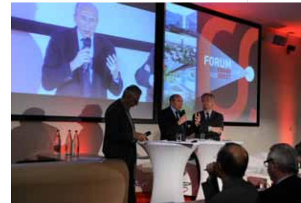
Forum Sud Ouest - 15 mars 2012 - Amphithéâtre Boiron, Pierre-Bénite

À cette occasion, l'Amphithéâtre Boiron de la Faculté de Médecine, situé sur le site des hôpitaux Sud, affichait complet. Pendant près de 3 heures, les élus du Grand Lyon et du Sepal ont livré leur regard sur le devenir de cet espace qui réunit 3 territoires de projet définis dans le SCOT: la Porte Sud Ouest, la Vallée de la Chimie et Givors.