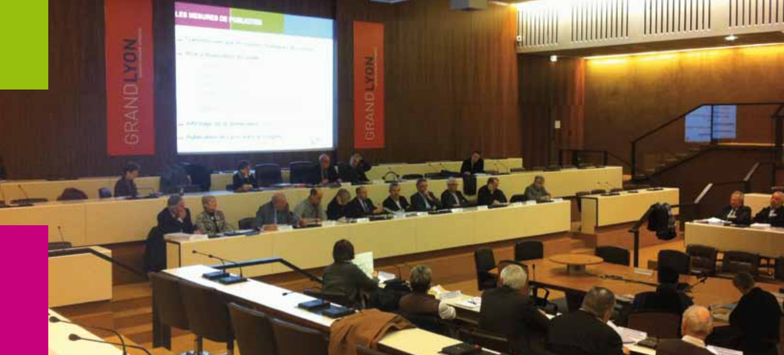
LE CONSEIL SYNDICAL DU SEPAL