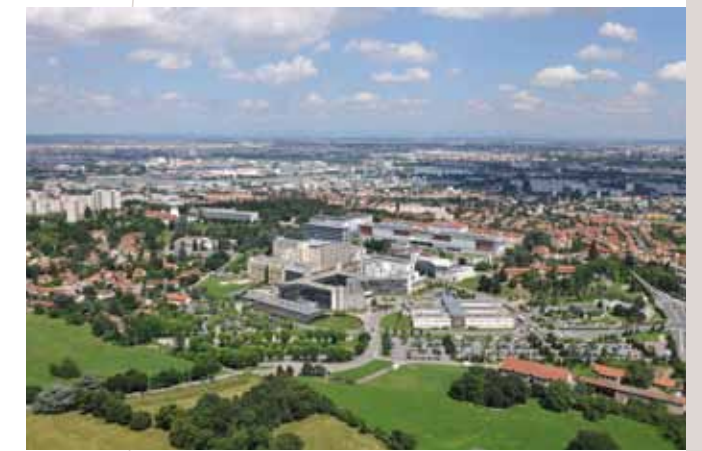
Site des Hôpitaux Sud

Le Sepal est associé à l'ensemble de ces travaux.