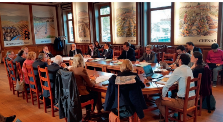
Rencontre des présidents de l'inter-Scot à Villefranche-sur-Saône - décembre 2019

L'année a également été marquée par la production d'un avis commun sur le SRADDET, l'organisation de rencontres territoriales rassemblant les chargés de mission « développement économique » des EPCI pour échanger sur les transferts d'établissements, ou encore l'analyse consolidée à l'échelle des 13 Scot des projections démographiques de l'INSEE à l'horizon 2040.