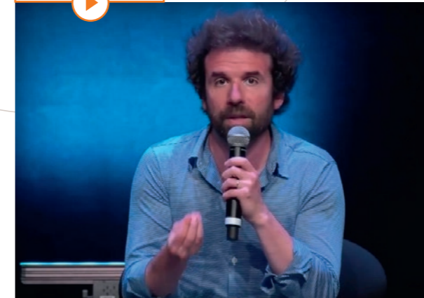
Cyril Dion aux Rencontres Nationales des Scot